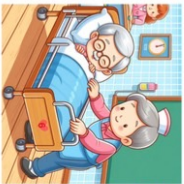
● 照顧床購買 居家醫生諮詢